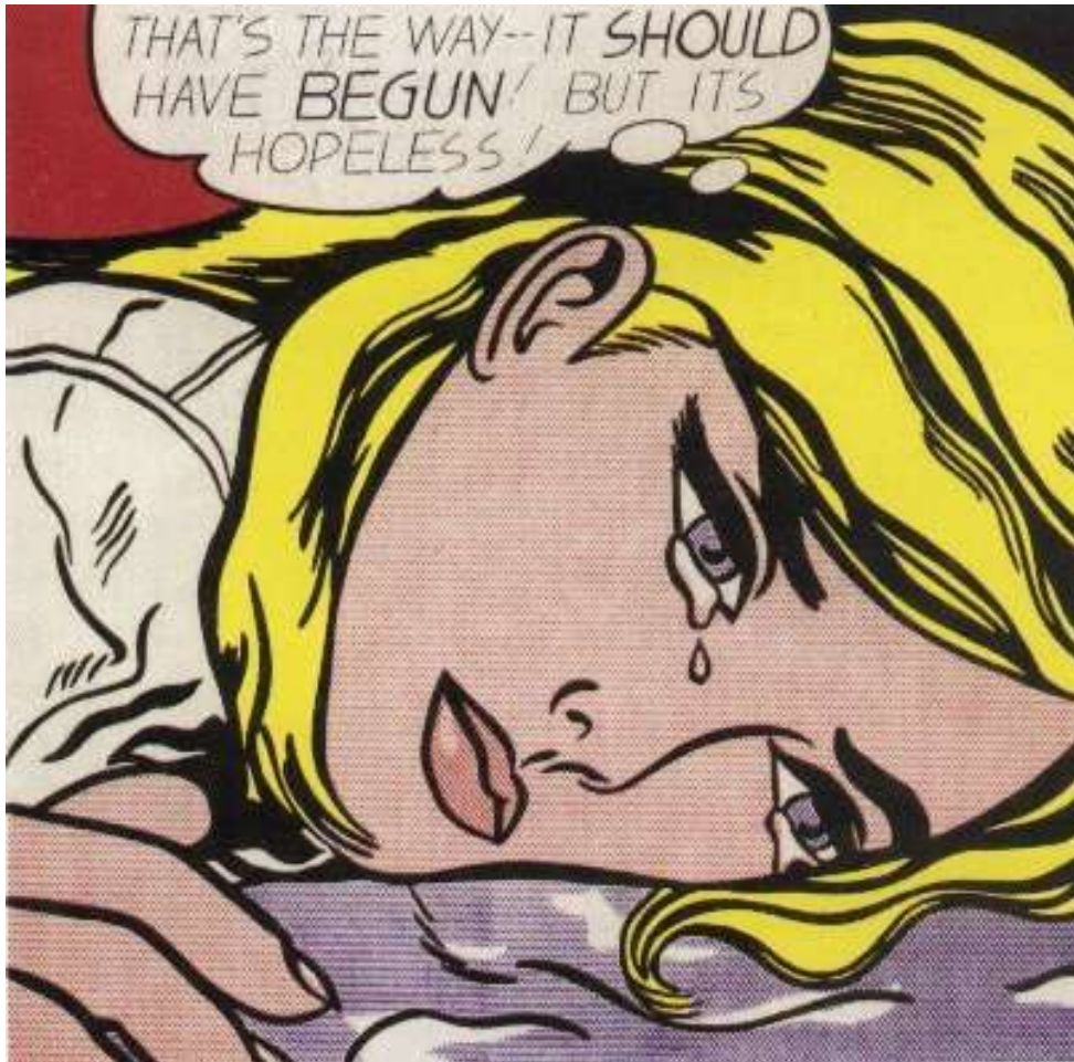
Roy Lichtenstein 1923-1997, Verenigde Staten, titel: ' Hopeless' ,1963

Roy Lichtenstein haalde zijn onderwerpen uit pulpstrips en advertenties die hij zelf beschreef als, "zo kunstmatig mogelijk" . "Het is de onverschilligheid, die conventionele, stereotype en lege emotie die ik wil laten zien" , aldus Lichtenstein.