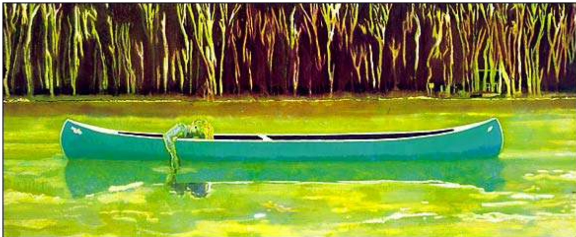
Canoe –lake,olie op katoen 1997 200x300cm

H."Meer gefascineerd door het idee van het geheugen dan door specifieke gebeurtenissen van mijn verleden".