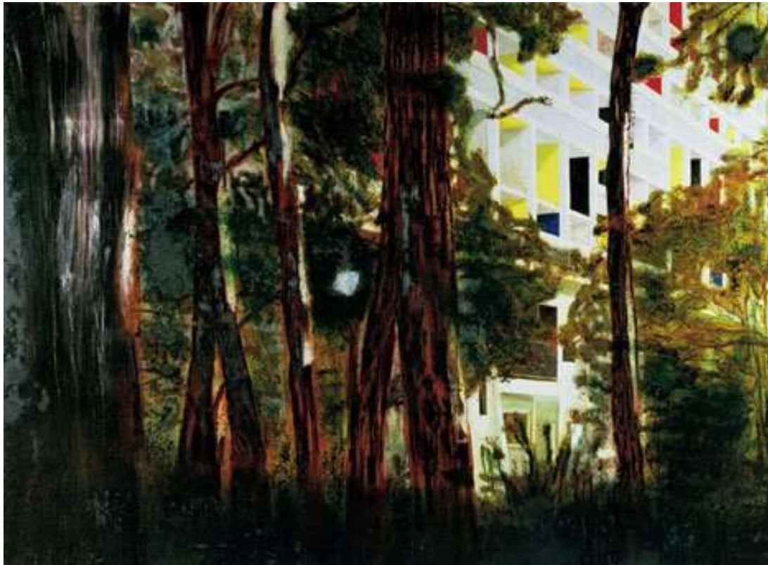
'Concrete cabin', olie op katoen, 1994 198x275cm

De serie schilderijen Concrete cabin 1994 zijn allemaal gebaseerd op een bijna verlaten Corbusier gebouw Briey-en Foret in het noordoosten van Frankrijk, die Doig tegenkwam tijdens een wandeling in het bos.