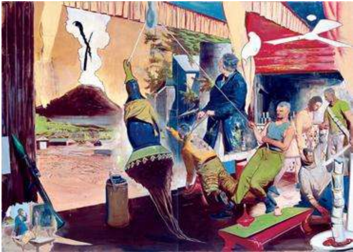
Neo Rauch 1960, Duitsland, titel: 'Das Alte Lied ( tweeluik)' 2006