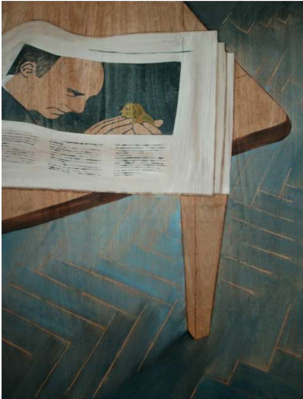
Astrid Rubie, Titel: "Poetin", 120x160, acryl op hout, 2008

Van de foto's die ik maak blijkt een enkele datgene te raken wat ik in het schilderen als uitgangspunt gebruik. Andere bronnen zijn fotografisch beeld van internet, krant of magazine.