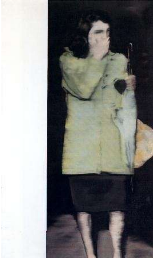
Gerhard Richter, woman with umbrella, 1964 Oil on canvas 160 x 95 cm

Richter geeft aan dat hij de inhoud van een foto fascinerender vindt dan de compositie. Hieronder ga ik in op bovenstaande foto.