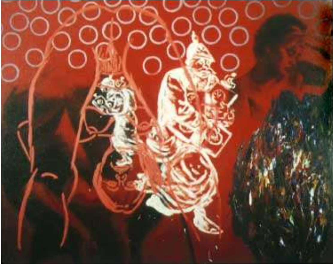
David Salle 1952 Amerika , titel; 'The burning bush' ,1982.