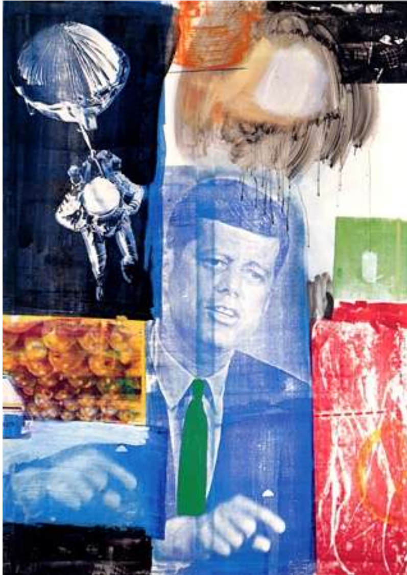
Robert Rauschenberg 1925-2008, Amerika, titel; retroactiv 2 1963

“Ik wil niet dat een schilderij lijkt op iets dat het niet is”. Ik wil dat het lijkt op iets dat het is. En ik denk dat een schilderij meer op de echte wereld lijkt wanneer het gemaakt is van de echte wereld” , zei Rauschenberg in een interview.