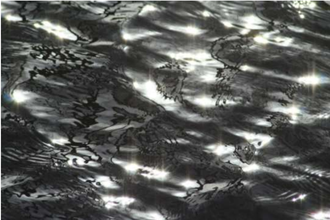
Astrid M.G. Rubie, Foto 2008

Een foto is mijn presentatie van een werkelijkheid. Een foto is een kader. Een groot deel valt er buiten. Ik bepaal de uitsnede, het moment, het belang, de maat als ik het vergroot etc.