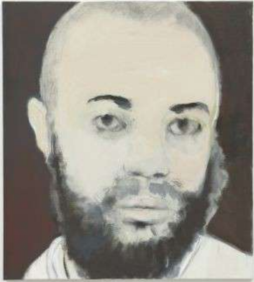
Marlene Dumas 1953, Nederland, titel: 'The Neighbour' 2005

The Neighbour, is afgeleid van een mediabeeld.