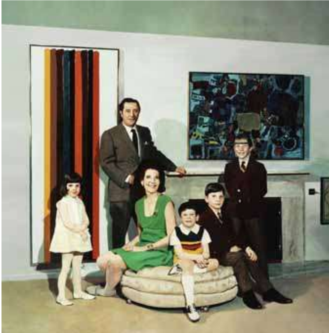
Malcolm Morley, 1931-heden, Engeland, titel: "Family Portrait", 1968