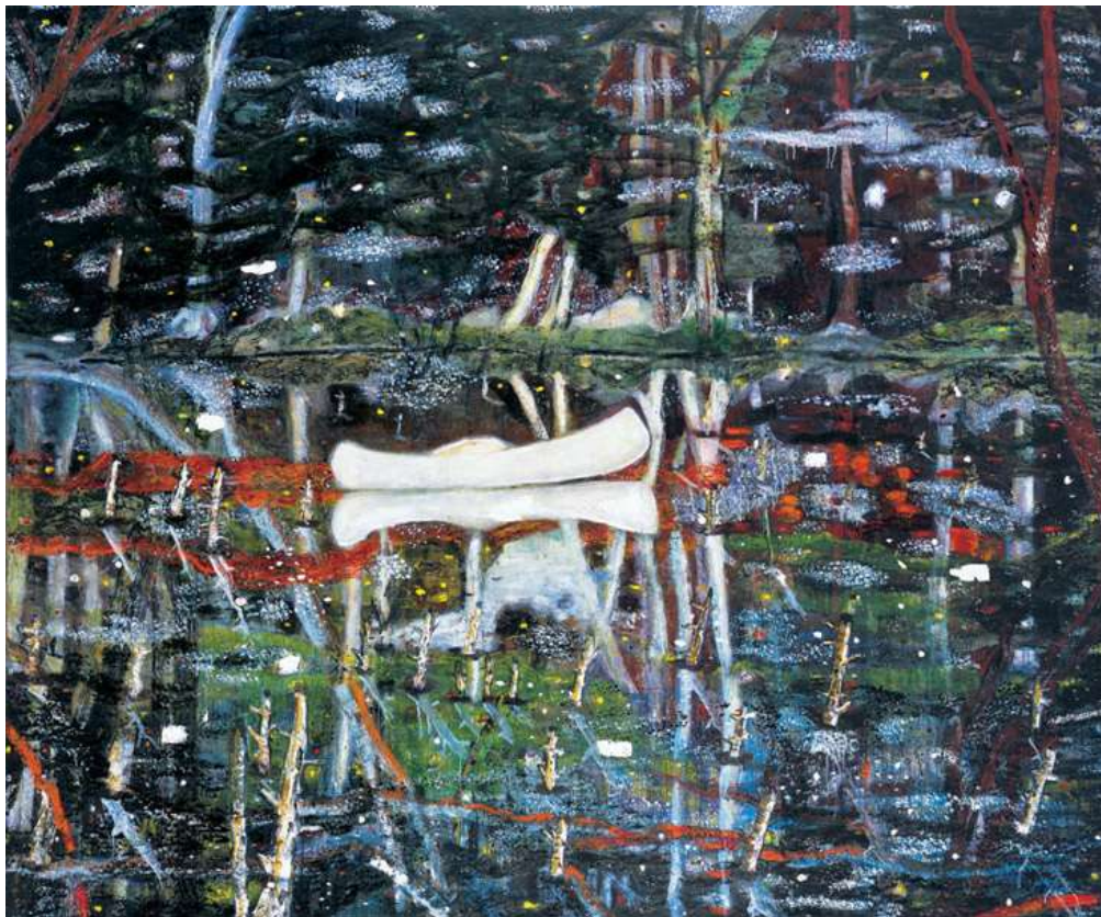
'White canoe' 1990,olie op canvas 200x243

A.Interview 2001. "De verbeelding moet worden voorzien van beeld. Ik ben geïnteresseerd in indirecte, bijna cliché voorstellingen van landschap. Hoe voorstellingen over landschap verschijnen en versterken in advertenties of film... Ik heb nog nooit een schilderij geheel vanuit mijn verbeelding gemaakt. Ze zijn altijd gemaakt uit fotografische bronnen die ik vond of gemaakt door mij zelf. Vaak refereren deze beelden terug naar herinneringen van speciale ervaringen. Sommige schilderijen refereren naar werkelijke mensen en werkelijke momenten, maar niet zo dat ik denk dat ik een psychologisch portret van iemand maak. Ik wil niet te specifiek zijn over geheugen. Ik wil het gebruiken op een algemene wijze, soms is het autobiografisch, maar niet expliciet. Ik gebruik fotografie simpelweg als verbeelding van het geheugen. De foto is een startpunt. De feitelijke daad van het maken van een schilderij is dat vindingrijkheid het overneemt. De fotografische bron is vaak te banaal, te begrensd. Het handelt primair in relatie tot de basis compositie voor een schilderij. Ik gebruik fotografie op een manier zoals sommige schilders in de 19 e eeuw fotografie gebruikte. Ik gebruik fotografie bijna als een kaart, een manier om het beeld in te delen" .