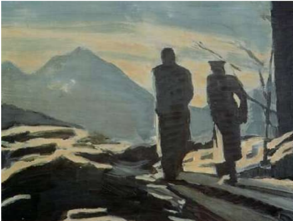
Titel: De wandeling, 1993, 37x48cm, oil on canvas

Tuymans gebruikt zowel filmbeelden als foto's. Nadat hij een film ziet bedenkt hij in welk beeld alles zit. Uit bovenstaande blijkt dat zijn benadering in het schilderen tegengesteld is.