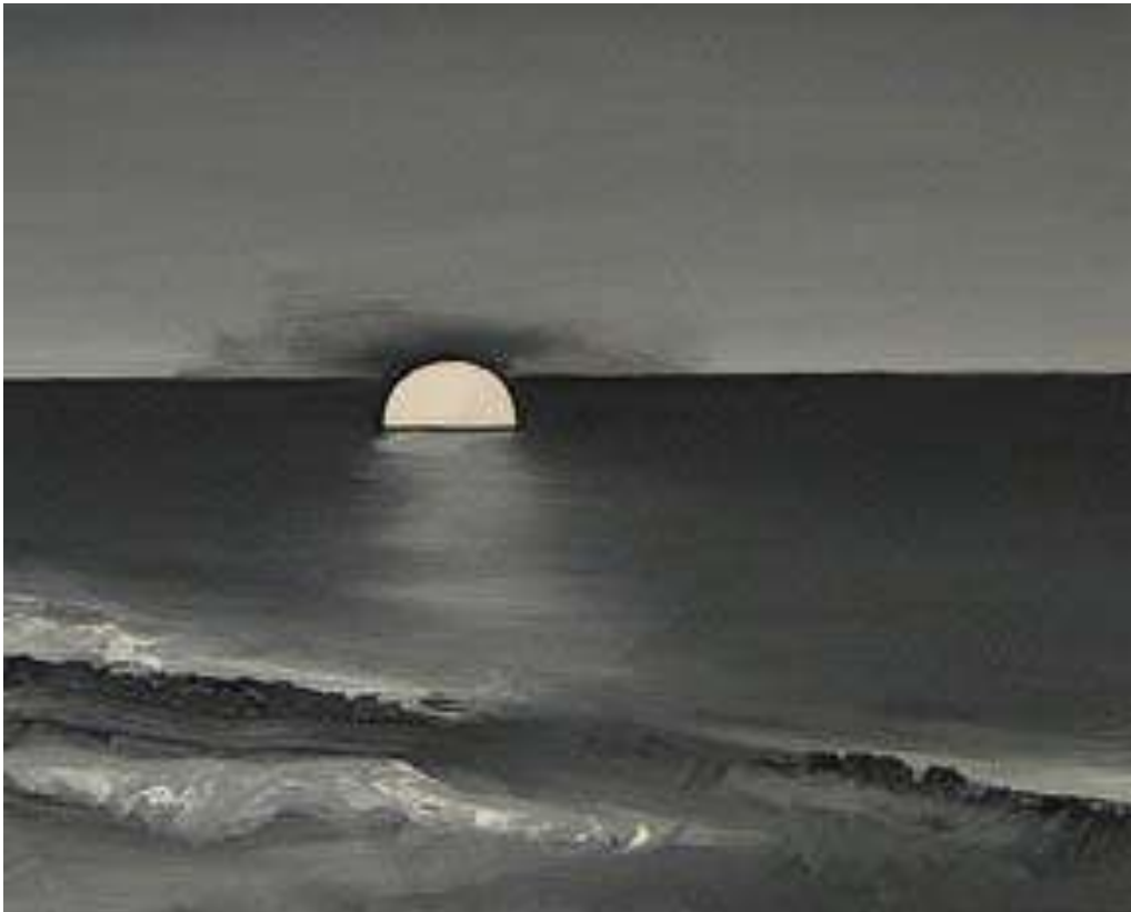
Wilhelm Sasnal geen titel 2007

Er zijn geen strikte regels om het beeld te kiezen. In de meeste gevallen vindt het beeld mij, eerder dan ernaar te zoeken."