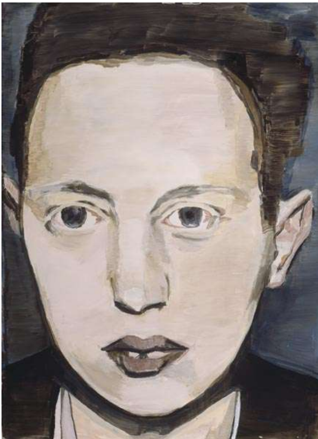
Der diagnostische Blick 5 1992 58x40cm oil on canvas

Het beeldmateriaal wat hij gebruikt zijn familiefoto's en foto's uit medische archieven, filmbeelden uit de oorlogsjaren, reproducties uit oude tijdschriften en reclamedrukwerk.