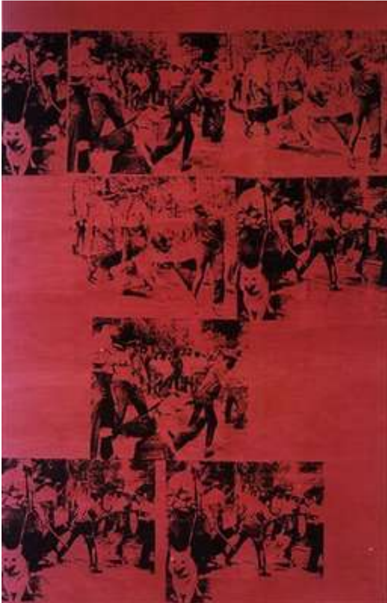
Andy Warhol 1928-1987, Verenigde Staten, titel Red Race Riot 1963

Warhol nam als onderwerp de werkelijkheid die ons via de media bereikt. Hij gebruikt hier fotografisch beeld uit een krant van een rassenspel die zich werkelijk heeft afgespeeld. Hij herhaalt 2 beelden in een werk. Het doet me denken aan seriële fotografie. Dit werk heeft een hoofdkleur waar het fotografische beeld als een filter over heen ligt. Menselijk leed, woede en angst. Citeert Warhol: “ Sommige mensen, zelfs intelligente mensen zeggen dat geweld mooi kan zijn. Ik begrijp dat niet, omdat er alleen mooie momenten zijn, en voor mij zijn dat soort momenten verre van mooi”. “Je kunt je niet voorstellen hoeveel mensen een schilderij van de elektrische stoel in hun kamer ophangen – vooral wanneer de kleur van het schilderij dezelfde is als die van de gordijnen” . De realiteitservaring van een afbeelding wordt eigenlijk ter discussie gesteld. In dit werk speelt fotografie door middel van de afbeelding zelf en de fotografische aspecten van de zeefdruktechniek een grote rol.