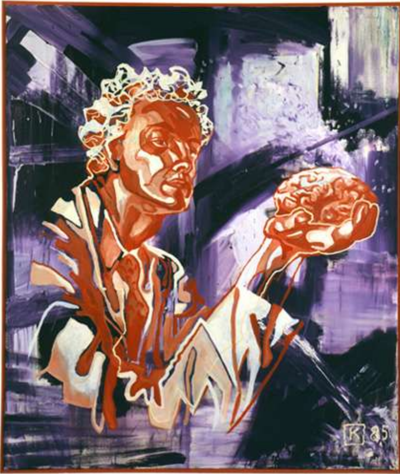
Martin Kippenberger 1953-1997, Duitsland Titel: "Junger Progressiver Arzt" 1985

Hoe Kippenberger onder andere aan zijn beeldmateriaal kwam voor een schilderij komt in een citaat uit 1976 naar voren; "Elke ochtend en elke middag schilderde ik vanuit een origineel. Tussendoor nam ik foto's en scheurde ik beeldmateriaal uit kranten. Zo had ik altijd genoeg beeldmateriaal" . Junger progressiver arzt is uit een latere periode, namelijk 1985.