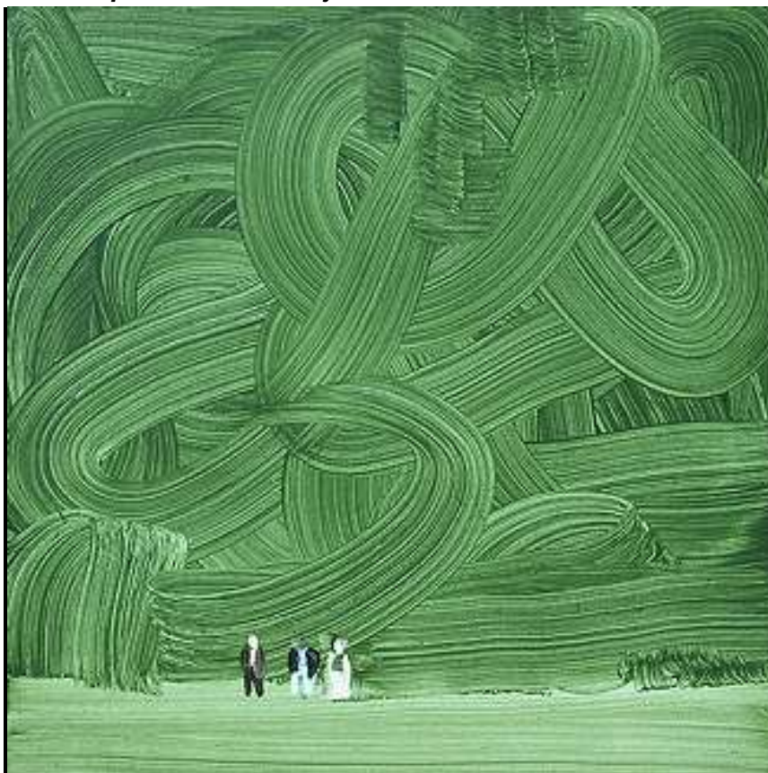
Wilhelm Sasnal 2003