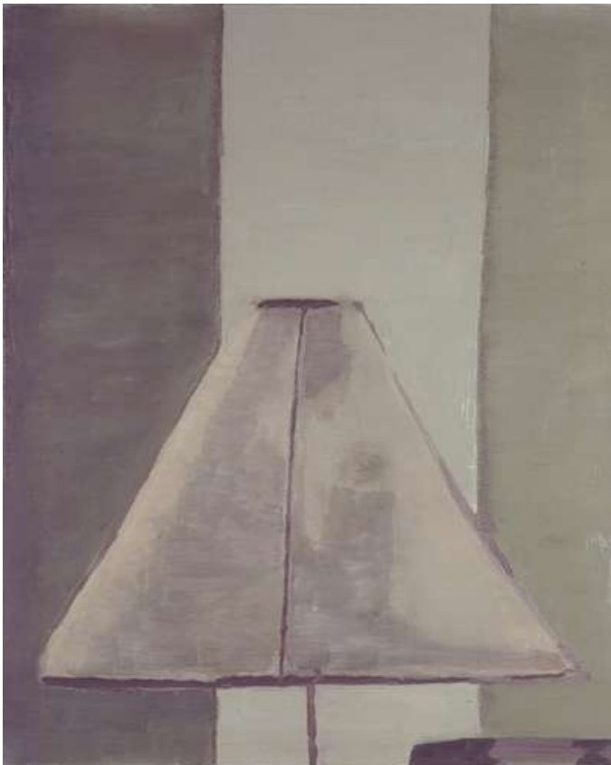
Titel: Lamp, 1994, Olie op katoen, 56 x 45 cm

F.1. 'Ik schilder niet de beelden zelf, maar de herinnering daaraan. Ik word getroffen door iets in de werkelijkheid, door een foto of door iets anders, onverschillig wat, als het me maar schokt. In het proces van het maken probeer ik de herinnering aan dat ene beeld weer te geven.'