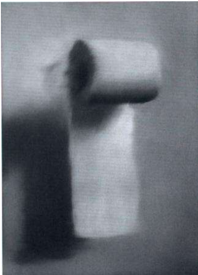
Titel:toiletpapier, 1965, 60x60 olieverf op doek

A.interview in 1986;" Ik keek naar foto's die presenteerde mijn recente leven, de dingen die gerelateerd aan mij waren. En ik koos voor zwart-wit foto's omdat ik me realiseerde dat ze meer effect hadden dan kleurenfoto's, directer, meer onartistiek en daarom geloofwaardiger. Daarom koos ik voor al deze amateur familieplaatjes, deze banale objecten en snapshots".